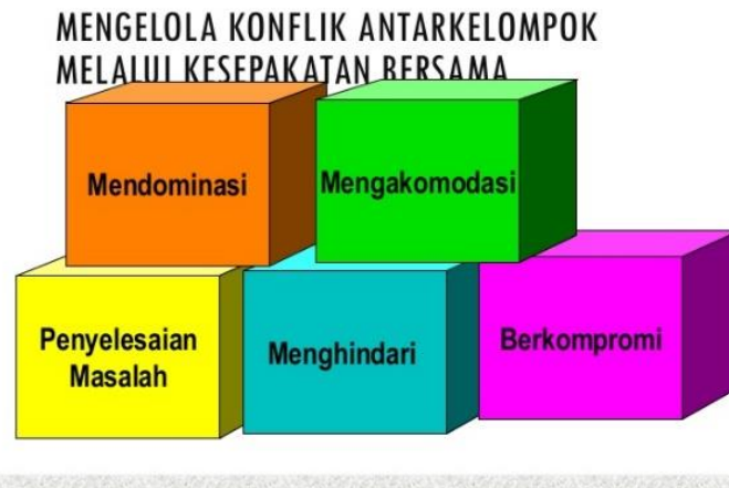
Gambar 2. Penggambaran Gaya Pengelolaan Konflik yang Dapat Dilakukan Dalam Organisasi

Pada Gambar 2, penulis mencoba memaparkan tentang teknik atau gaya pengelolaan konflik yang biasa dilakukan, baik dalam hubungan antar pribadi, antar keluarga, antar organisasi, maupun melalui perantara media sosial.