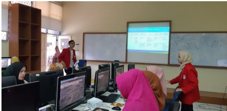
Gambar 2. Peserta latihan membuat program kerja menggunakan Trello

Pada saat penyampaian materi, peserta dapat langsung bertanya jika terdapat hal yang tidak di mengerti dari materi yang disampaikan. Dan pada bagian akhir, peserta akan diminta untuk membuat Program Kerja PKK menggunakan Tools Trello , seperti yang terlihat pada Gambar 2. Latihan program kerja PKK yang ditugaskan merupakan program yang kemungkinan besar peserta mengetahuinya untuk memudahkan peserta dalam menggunakan Tools Trello .